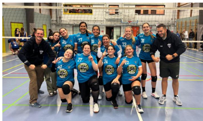
Équipe P4 dames composée majoritairement de jeunes joueuses

Les équipes tournent à plein régime. La P1 messieurs a connu quelques difficultés en rencontrant les favoris, mais elle a cependant remporté quatre victoires en sept matches. Récemment, elle a battu (3-0) l'équipe de Capci-Wb Volley (Ixelles) et le Sporta Brussels Volley (2-3) ; elle compte bien continuer dans cette voie.