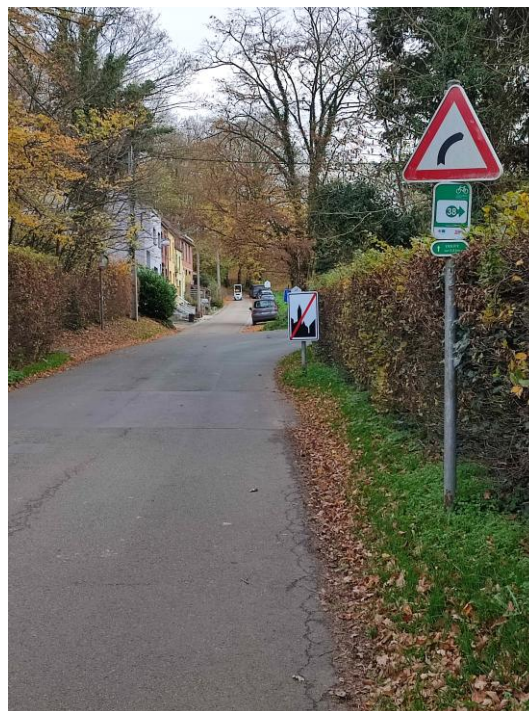
Le panneau F3a (fin d'agglomération) va disparaître. Fin de la situation absurde qui permettait de passer de 50 à 90 km/h à cet endroit.

La vitesse sera désormais limitée à 50 km/h sur toute la longueur de la rue du Try-au-Chêne, soit de la rue du Grand Arbre à la rue du Cerisier. C'est la fin d'une situation absurde : limite à 90 km/h dans cette rue à forte pente !