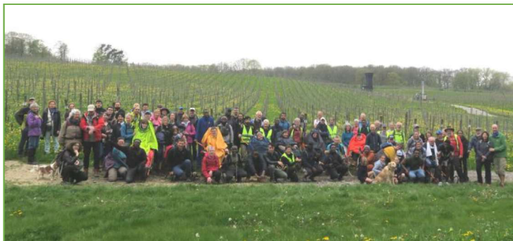
Dans le vignoble

Un beau moment de convivialité et d'échange entre les Bousvaliens, les PMR et les demandeurs d'asile.