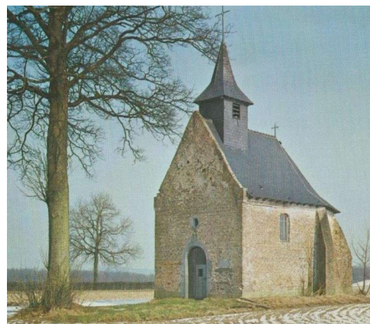
No tchapèle dins l'timps

Un tri est une friche. C'est un des plus beaux paysages de notre commune.