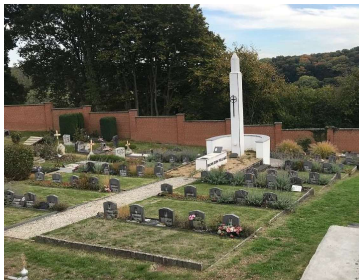
Pelouse d'honneur, cimetière de Bousval

Nous vous invitons bien cordialement à prendre un peu de votre temps et à participer dans la mesure de vos disponibilités à la petite cérémonie et au dépôt de fleurs au Monument aux Morts sur la place de Bousval. PGO