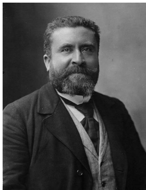
Jean Jaurès, homme politique français, 1859-1914

l'interdépendance entre les éléments et les êtres humains et, plus particulièrement, les femmes et les hommes de chez nous, à Bousval.