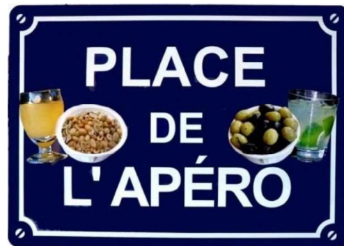
La place Communale rebaptisée pour l'occasion ?

Nous voulons aussi vous présenter le village à travers quelques photos et autres supports.