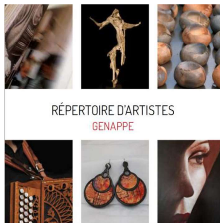
RÉPERTOIRE D'ARTISTES GENAPPE

Voilà un excellent ouvrage à mettre dans notre bibliothèque, à offrir en cadeau ! De quoi nous inspirer et « régaler » nos yeux ! De quoi nous permettre de garder un souvenir de tous ces artistes passionnés !