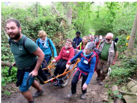
Mieux qu'un long discours : effort dans la montée

Thy ; arrêt au manège de Ways ; une glace bien méritée à la ferme artisanale de Bousval et, avant de se séparer, un petit verre à la buvette de la salle omnisports.