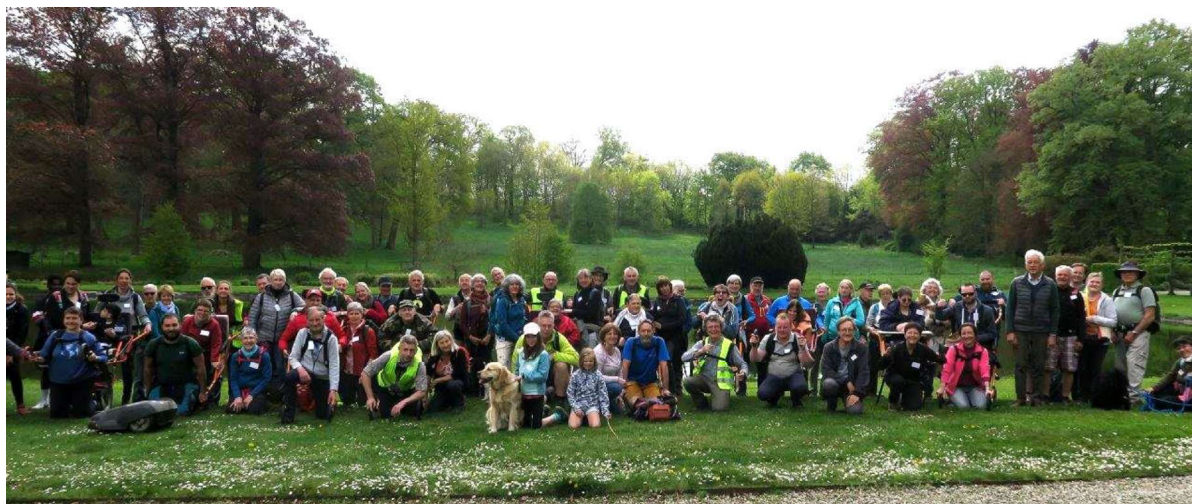
Pique-nique au château de Thy

Le dimanche 1 er mai, les Amis de Bousval et l'asbl Handi-Rando ont organisé leur deuxième randonnée en joëlette : dix kilomètres par les sentiers le long de la Dyle et de la Falise dans une ambiance chaleureuse ; pique-nique enchanteur dans le parc du château de