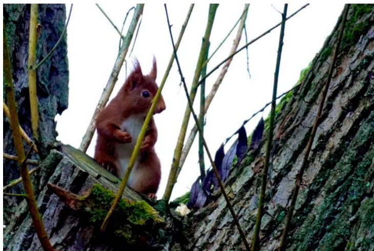
Un autre « rendez-vous », avec un écureuil cette fois

Après la mise en forme matinale, équipé de son appareil Sony hybride, il trouve le calme sur nos sentiers, sur le RAVeL, le long de la Dyle, ... le calme et aussi l'attention soutenue, l'espoir de faire de belles rencontres, comme celle de ce chevreuil : le face-à-face à 1,5 m, les yeux dans les yeux, et la réaction immédiate, l'instantané pris sur le vif !