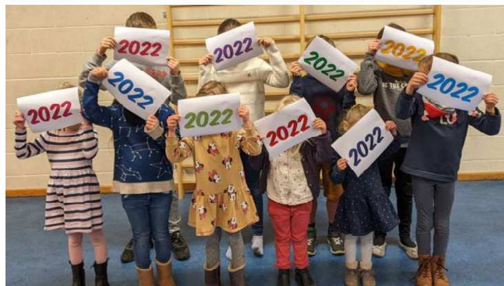
Un élève de chaque classe pour présenter les rêves et les vœux

Et enfin, nos grands élèves de 6 e primaire rêvent avant tout de vivre une année 2022 « normale », pleine de joie et de paix, avec une fancy-fair, des parents qui viennent faire la fête dans l'école, des fêtes entre copains, des classes de dépaysement et des sorties. Et comme nous tous, ils souhaitent vraiment la disparition du covid pour ne plus devoir porter le masque, pour que les classes ne ferment plus, pour que tout le monde soit en bonne santé et pour juste s'amuser, peu importe comment.