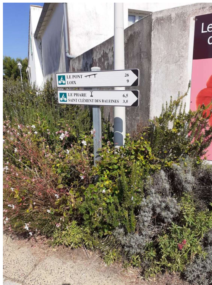
Un des exemples de signalisation destinée aux cyclistes