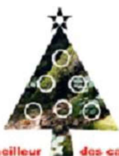
Le meilleur des cadeaux

En cette fin d'année 2021, moment festif où nous partageons des cadeaux, c'est le moment d'en faire un très original à un proche ou à un enfant.