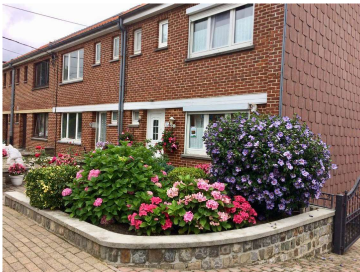
Avenue de l'Horizon 75

Nous faisons deux constatations : d'abord, les façades primées sont souvent celles de maisons mitoyennes car les jardins des maisons 4 façades, même fleuris, sont peu visibles de la rue.