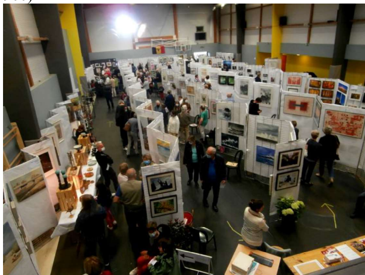
Vue d'ensemble de l'exposition

Eh bien, 1.400 fois oui ! Les 80 exposants (peintres, photographes, sculpteurs) et le comité ont été ravis d'accueillir près de 1400 visiteurs dans la salle omnisport (l'édition de 2019 en avait accueilli plus de 900).