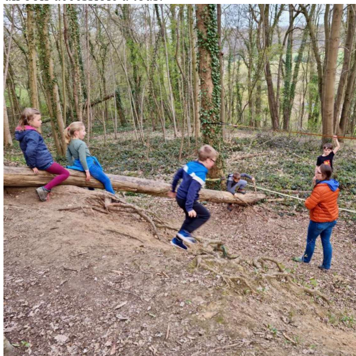
Un toboggan improvisé

Ils sont convaincus qu'il est important de leur transmettre les valeurs de respect de la nature, de protection de la biodiversité et de la convivialité dans un bois accessible à tous.