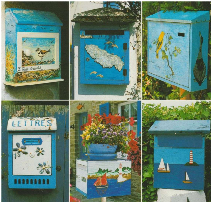
Des idées ?