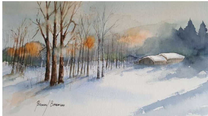
Neige, lumière, couleur, rêve, passion, sensibilité