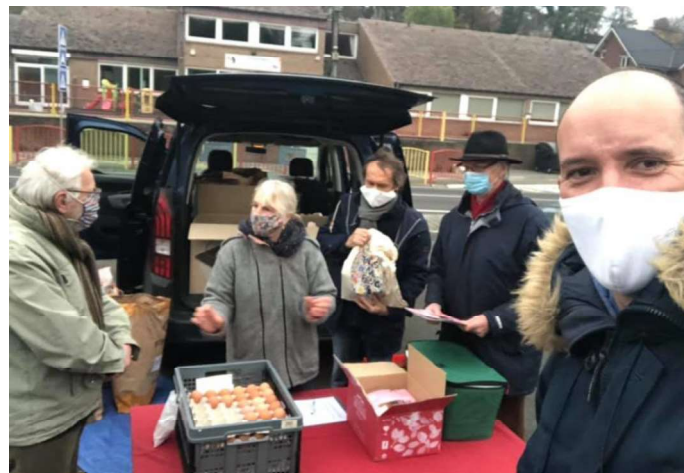
Distribution place de la Gare : froid aux mains et chaud au cœur

Pourtant, les familles ont été au rendez-vous et nous avons pu proposer 40 paniers, soit le petit déjeuner de 140 personnes. Et si la température était un peu fraîche sur notre point de distribution, chaleur et convivialité n'y ont pas manqué.