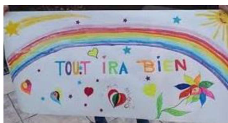
Ensemble nous en sommes certains : tout ira bien !

Nous ressentons beaucoup d'émotions à la fois. Parfois la peur, le stress, l'incertitude, la culpabilité mais aussi la déception de cette fin d'année scolaire, la déception de quitter nos élèves de cette façon et plus particulièrement les sixièmes qui nous quittent cette année.