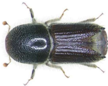
Taille réelle : 4 à 6 mm

Le site Scolytes.be fournit des outils et conseils aux propriétaires forestiers concernés afin d'apporter des solutions à cette crise sanitaire et économique. Les arbres qui présentent au moins un des symptômes d'attaque doivent idéalement être évacués dans les 15 jours qui suivent la détection.