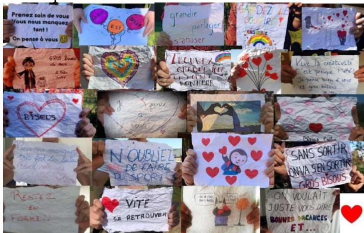
Message « boulette »

l'encontre de certaines valeurs que nous prônons depuis toujours dans notre école de cœur. Cette distance nous attriste, perturbe les enfants qui ne comprennent pas toujours pourquoi ils ne peuvent plus faire de câlins à leurs copains.