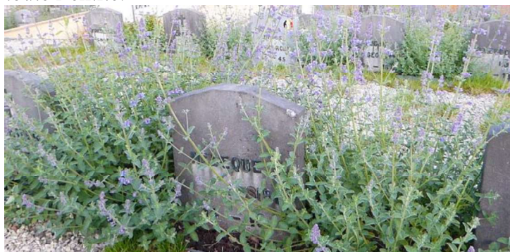
Fleurs sauvages dans le cimetière, avant la floraison des coquelicots

La ville de Genappe pourrait étendre le concours à toute l'entité.