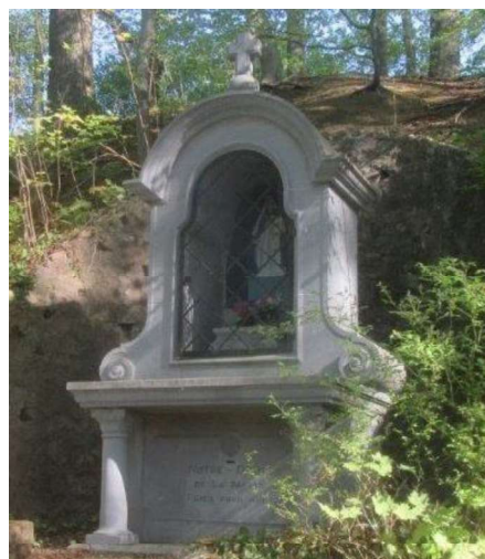
Chapelle N.-D. de La Motte, rue du Sablon

Vous êtes manifestement nombreux à apprécier ce patrimoine exceptionnel (...) !