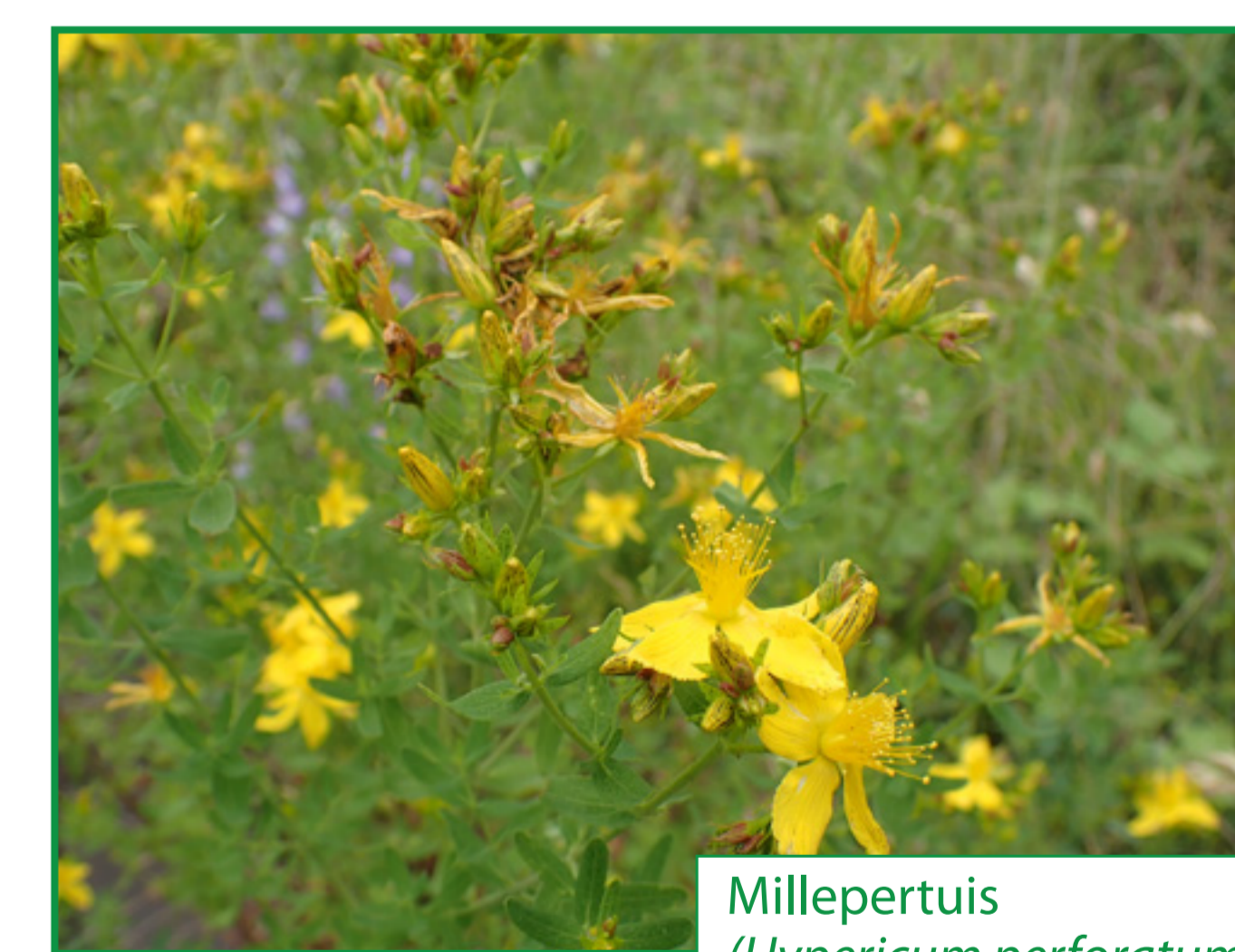
Millepertuis ( Hypericum perforatum )