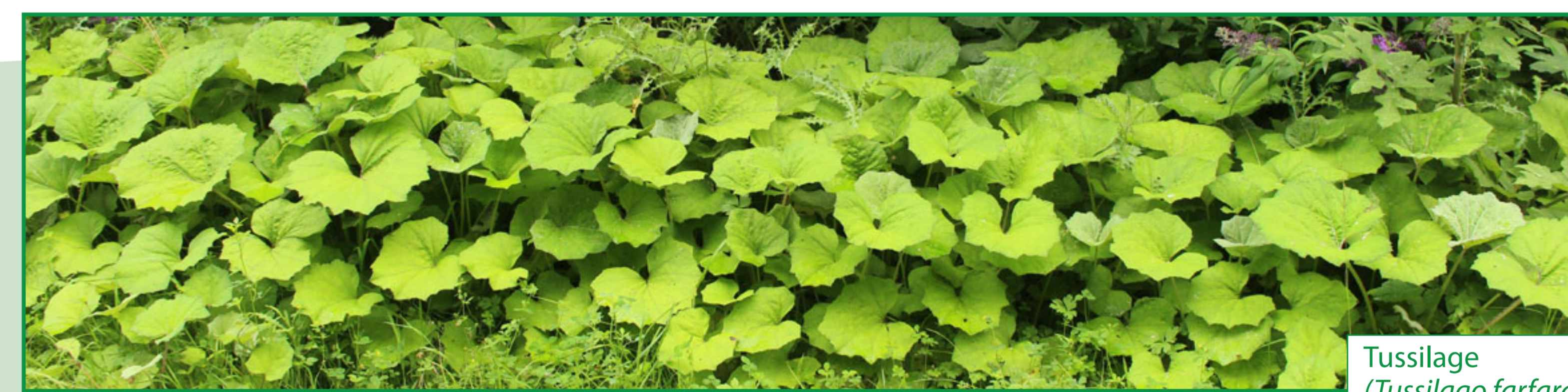
Tussilage ( Tussilago farfara )

Tout savoir sur le circuit "Entre Dyle et RAVeL"