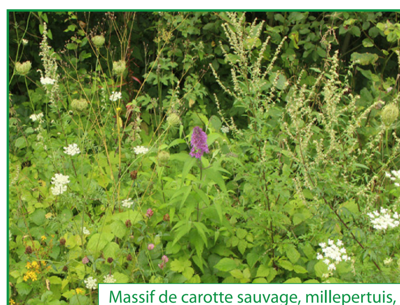
Massif de carotte sauvage, millepertuis, armoise et fleur d'arbre à papillons

À cet endroit, nous souhaitons installer un pré fleuri constitué au départ des fleurs déjà naturellement présentes sur la zone herbeuse du RAVeL, en y ajoutant, par semis, différentes espèces qui font partie de la flore représentative de nos fonds de vallée.