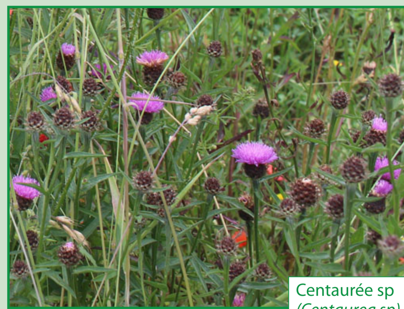
Centaurée sp ( Centaurea sp. )