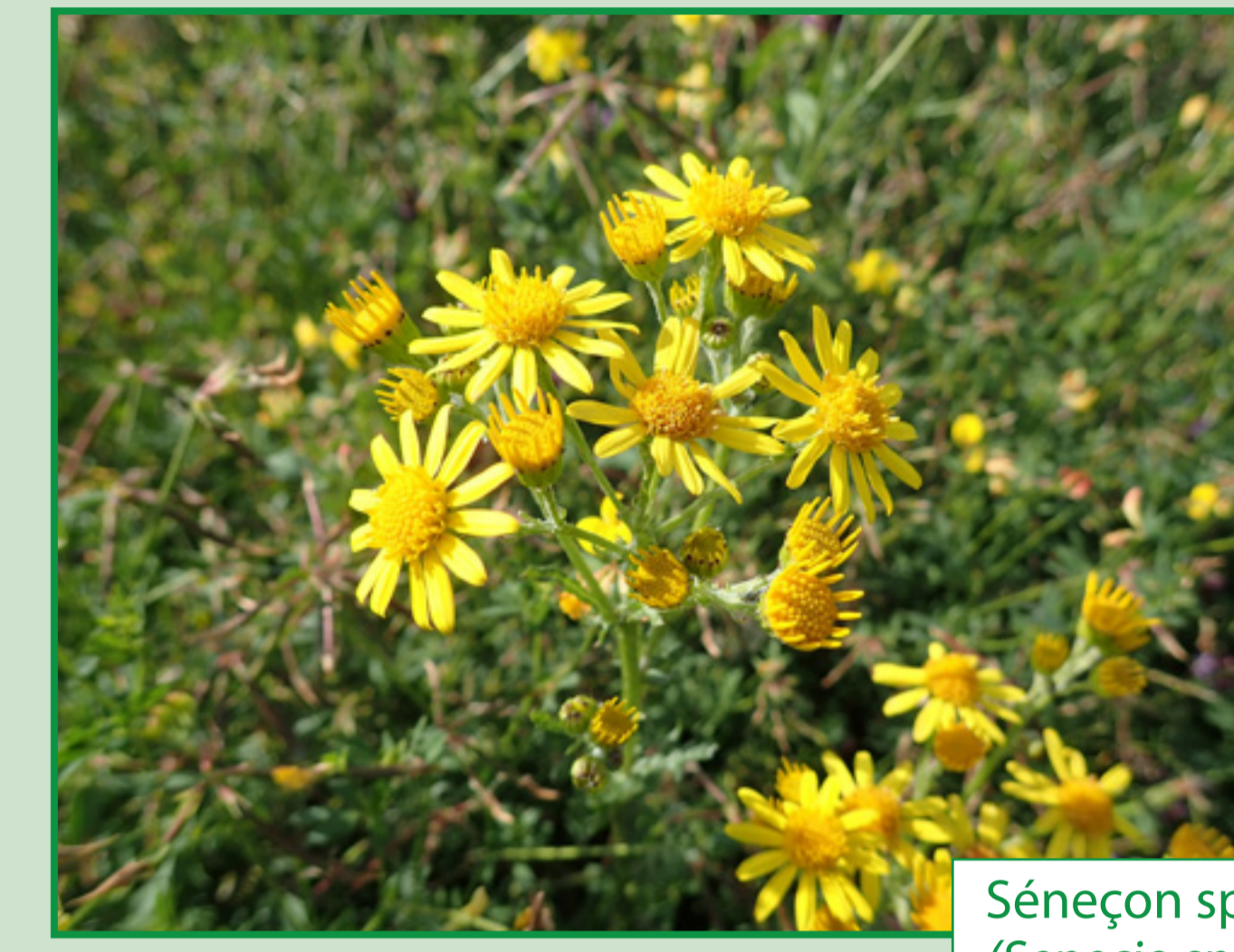
Séneçon sp ( Senecio sp. )