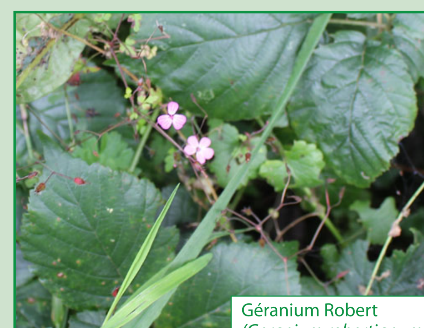
Géranium Robert ( Geranium robertianum )