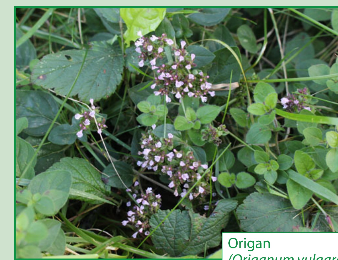
Origan ( Origanum vulgare )