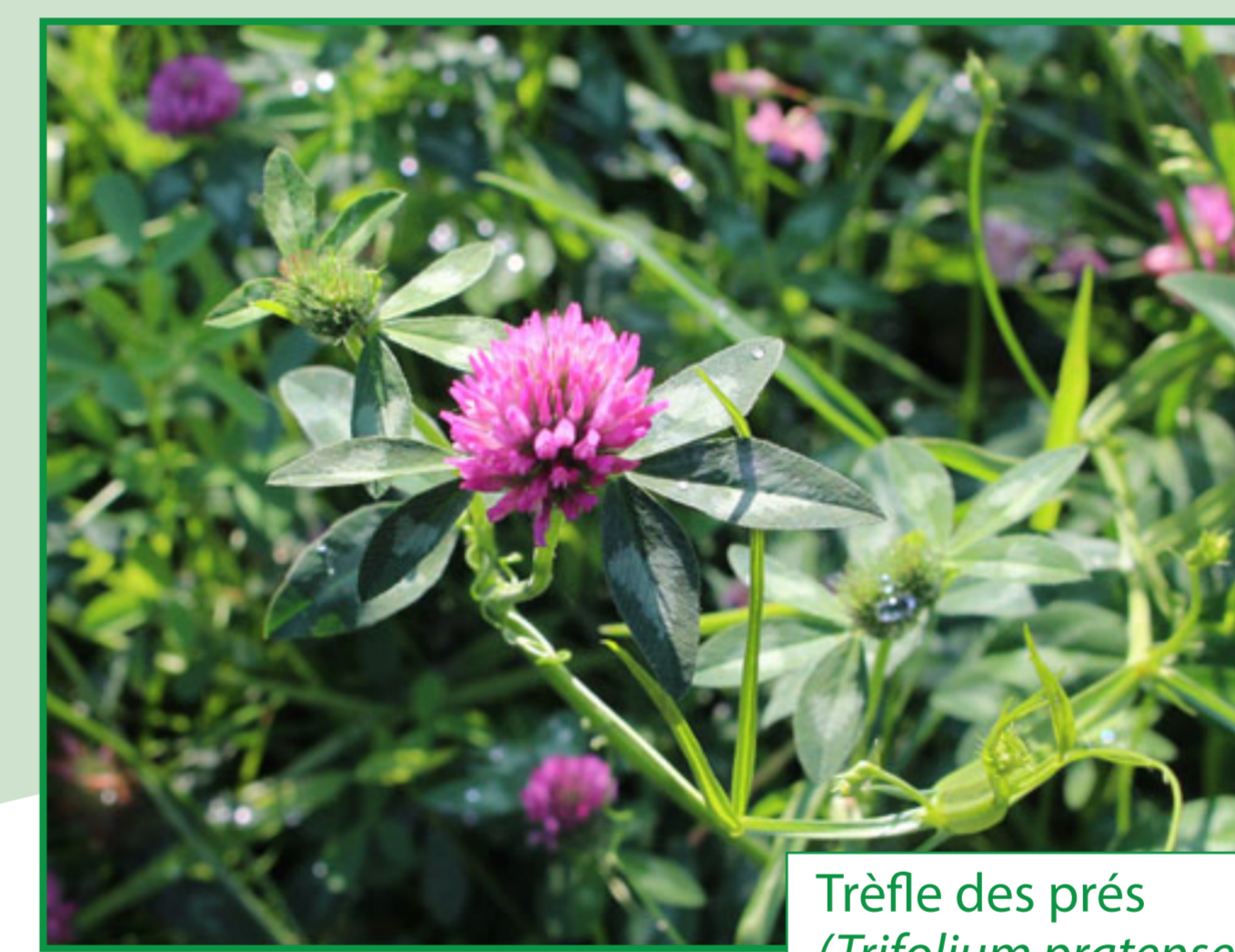
Trèfle des prés ( Trifolium pratense )