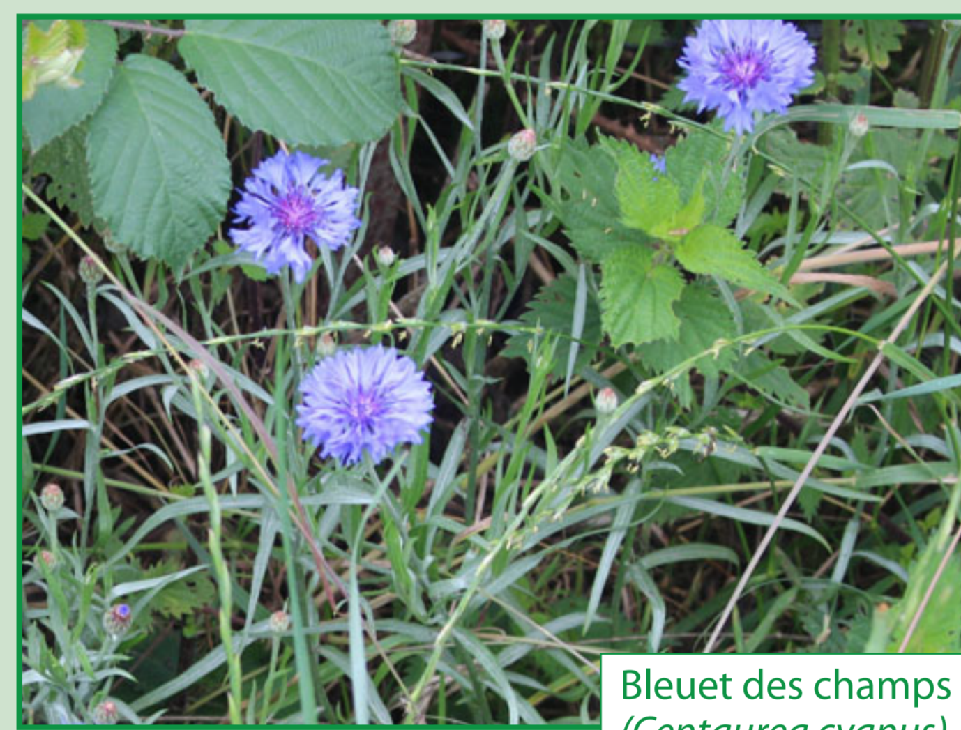
Bleuet des champs ( Centaurea cyanus )