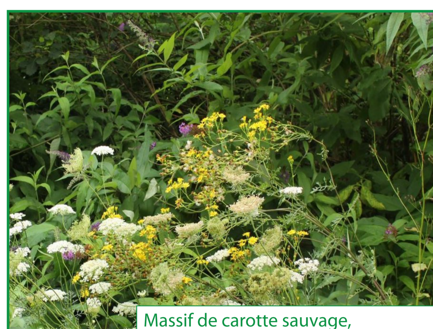
Massif de carotte sauvage, séneçon devant un arbre à papillons

Un pré fleuri est un espace constitué de plantes à fleurs et de graminées sauvages qui fleurissent du printemps à l'automne et qui attirent papillons, pollinisateurs et petits oiseaux chanteurs.