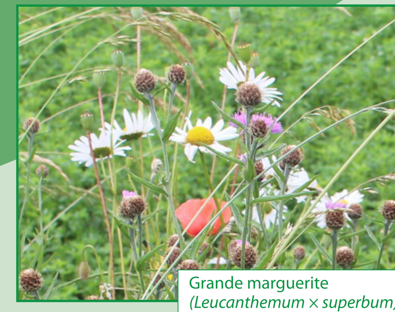
Grande marguerite ( Leucanthemum x superbum )

Un pré fleuri est un espace constitué de plantes à fleurs et de graminées sauvages qui fleurissent du printemps à l'automne et qui attirent papillons, pollinisateurs et petits oiseaux chanteurs.