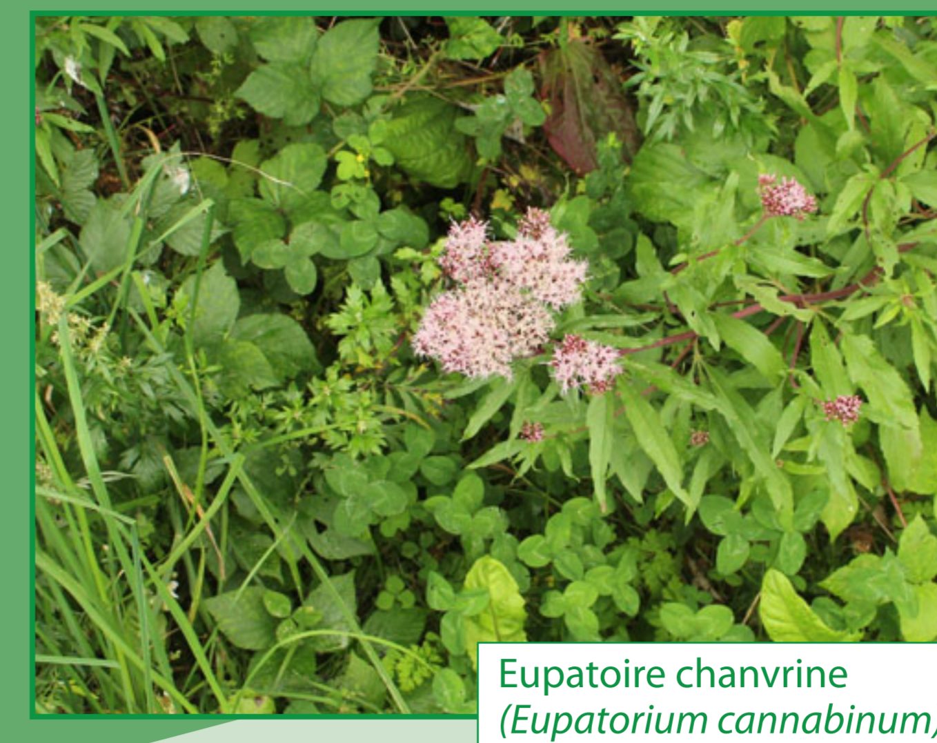
Eupatoire chanvrine ( Eupatorium cannabinum )