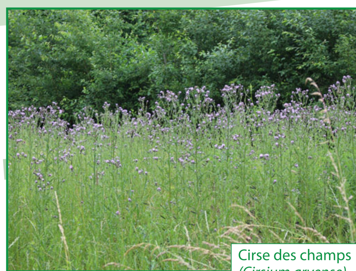
Cirse des champs ( Cirsium arvense )