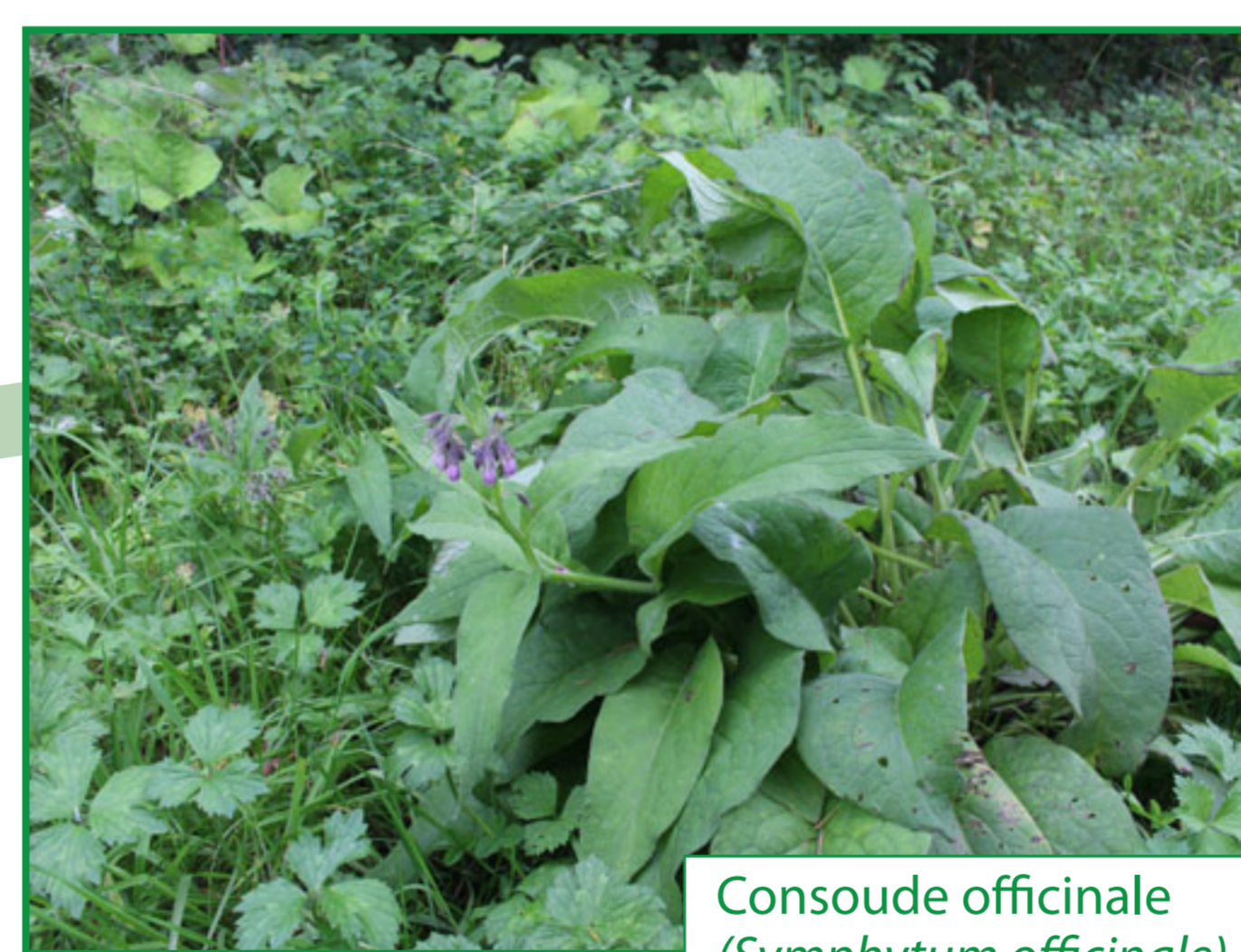
Consoude officinale ( Symphytum officinale )