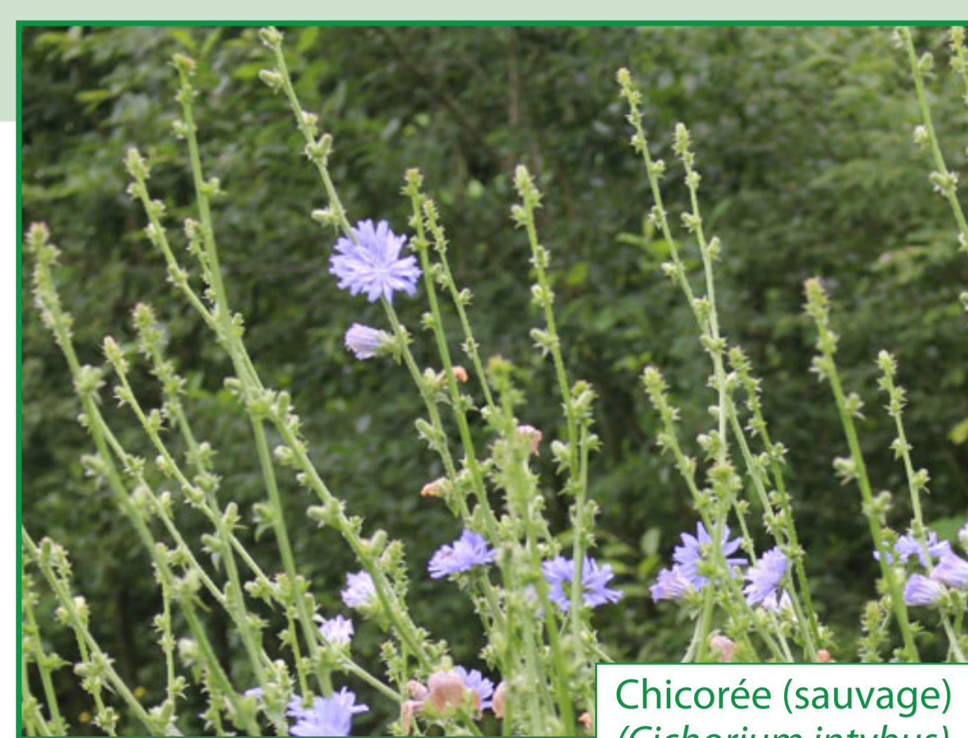
Chicorée (sauvage) ( Cichorium intybus )