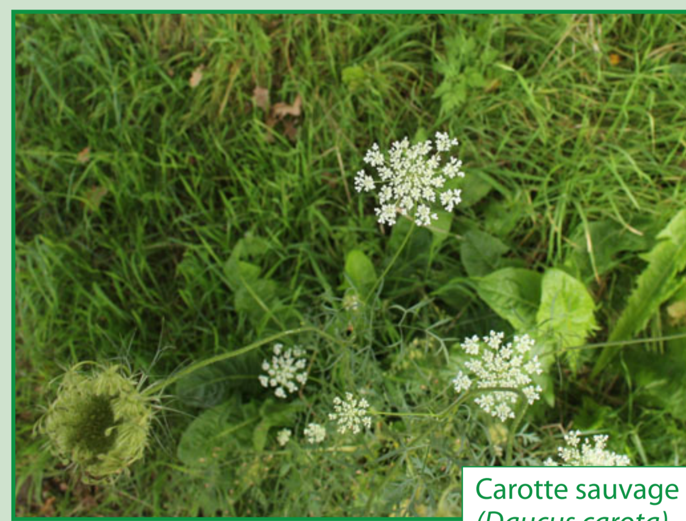
Carotte sauvage ( Daucus carota )