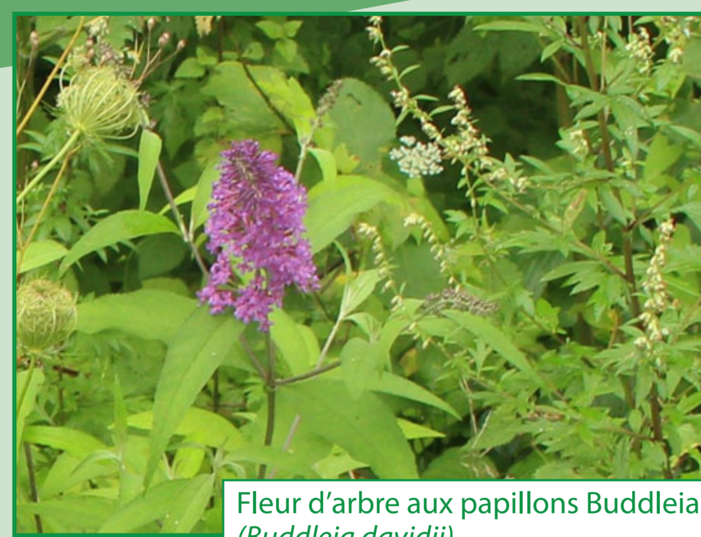
Fleur d'arbre aux papillons Buddleia ( Buddleja davidii )

Les photos de fleurs et de plantes de ce panneau ont, pour la plupart, été prises sur la zone herbeuse le long du RAVeL. Ce sont ces plantes et fleurs que l'on trouve le plus couramment à cet endroit et qui constituent la base de notre pré fleuri.