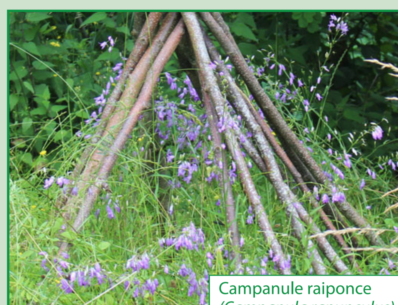
Campanule raiponce ( Campanula rapunculosa )