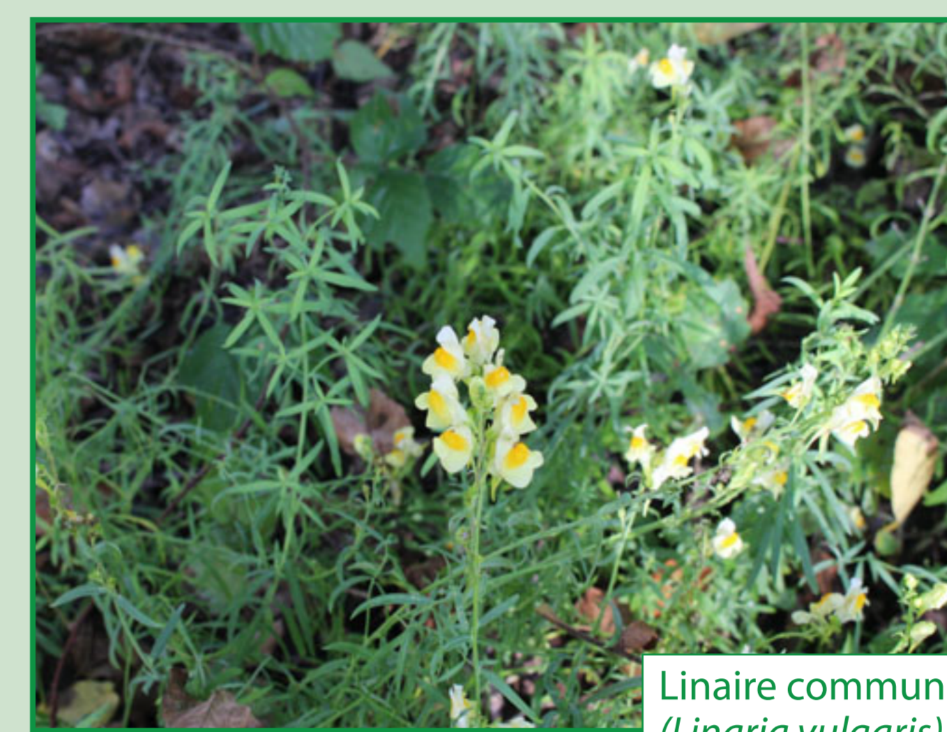
Linaire commune ( Linaria vulgaris )