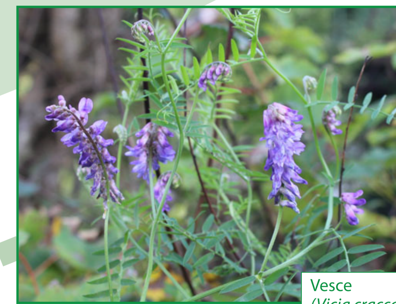
Vesce ( Vicia cracca )