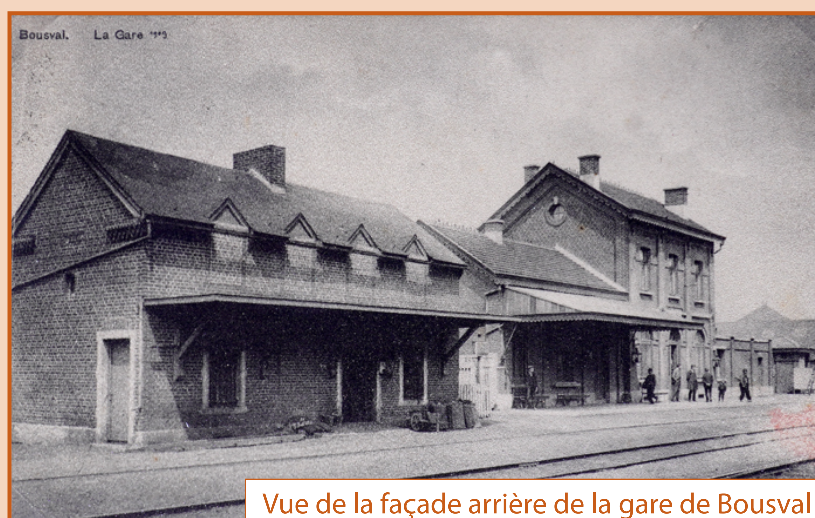
Vue de la façade arrière de la gare de Bousval (environ 1900)