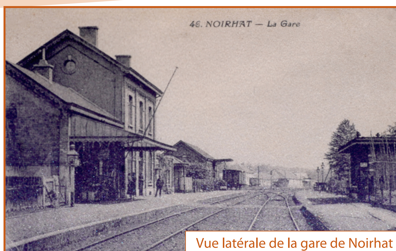
Vue latérale de la gare de Noirhat (environ 1900)

Tout savoir sur le circuit "Entre Dyle et RAVeL"