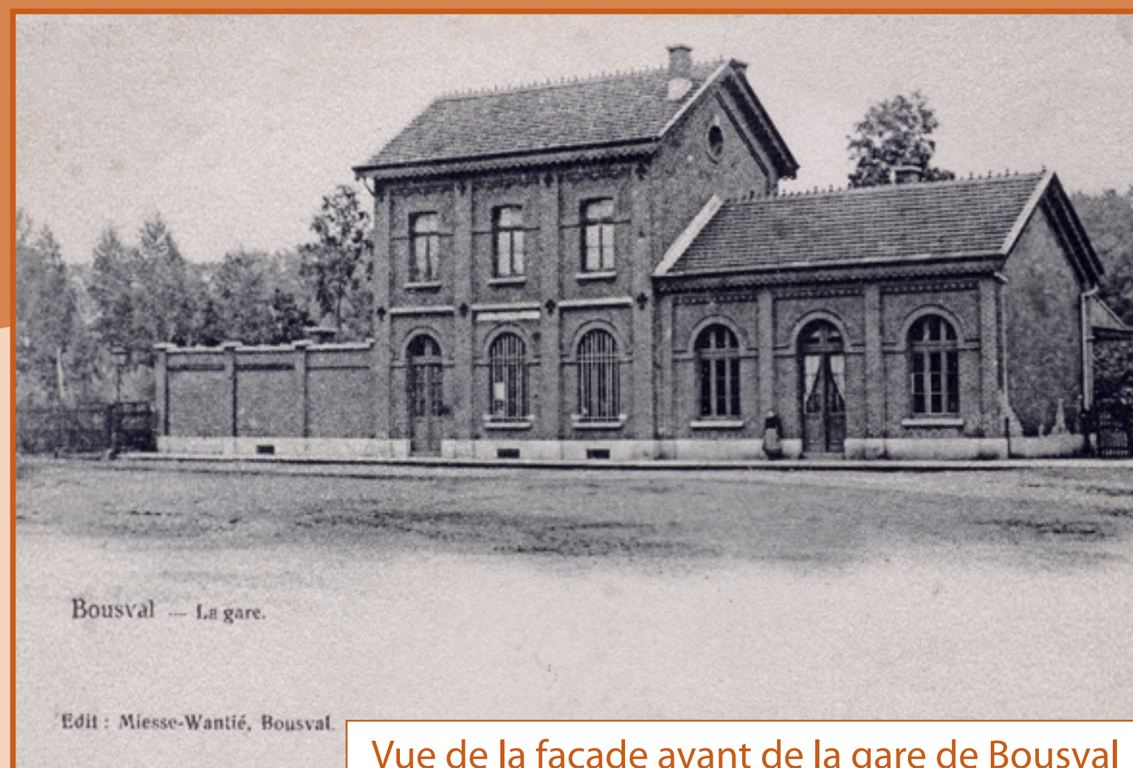
Vue de la façade avant de la gare de Bousval (environ 1900)