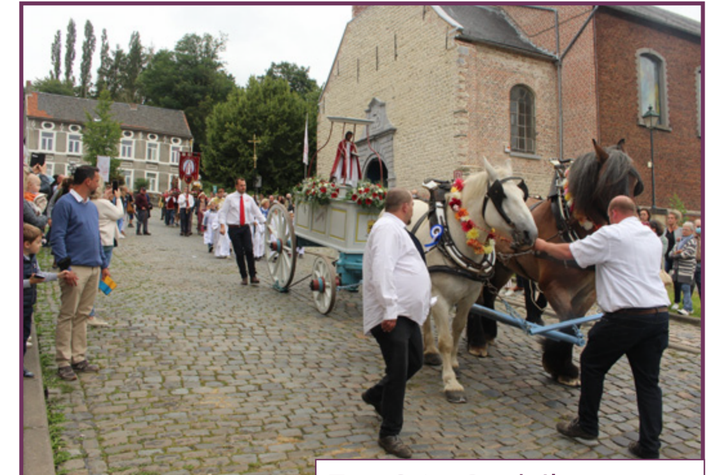
Tour Saint-Barthélemy - 2021

Le traditionnel Tour Saint-Barthélemy est intimement lié au monde rural de Bousval depuis au moins 1696. La procession, qui effectue un circuit autour du centre du village après la messe dominicale du premier dimanche qui suit le 24 août, se caractérise par le fait que le char sur lequel repose la statue de saint Barthélemy est tiré par des chevaux de trait brabançons. La procession est précédée par des cavaliers. Elle s'arrête à 7 chapelles sur un parcours de 5 km. La procession se termine par la bénédiction des chevaux, qui rappelle l'importance qu'ils ont joué de tout temps dans la vie du village.