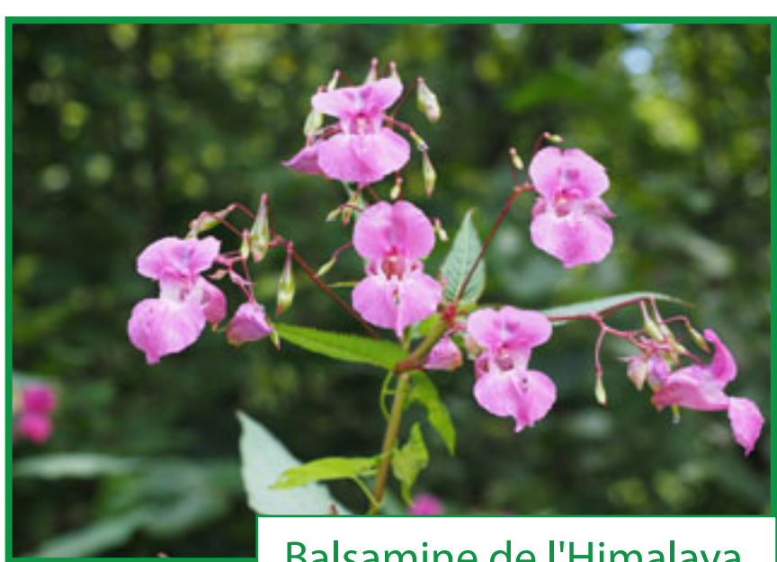
Balsamine de l'Himalaya

La balsamine de l'Himalaya ( Impatiens glandulifera ) : un air inoffensif et de jolies fleurs roses parfumées la rend