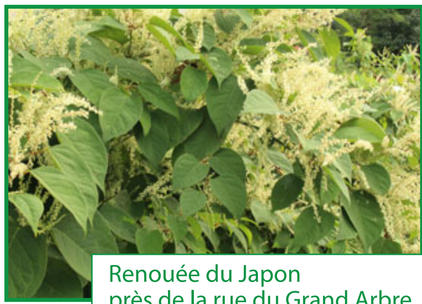
Renouée du Japon près de la rue du Grand Arbre

La renouée du Japon ( Fallopia japonica ) : semblable à une canne de bambou, elle peut pousser de 3-4 cm par jour et atteindre facilement 2,5 à 3 m de hauteur. Elle est très difficile à éradiquer car la densité de ses rhizomes dans le sol est importante, et un petit fragment de racine suffit à régénérer la plante.