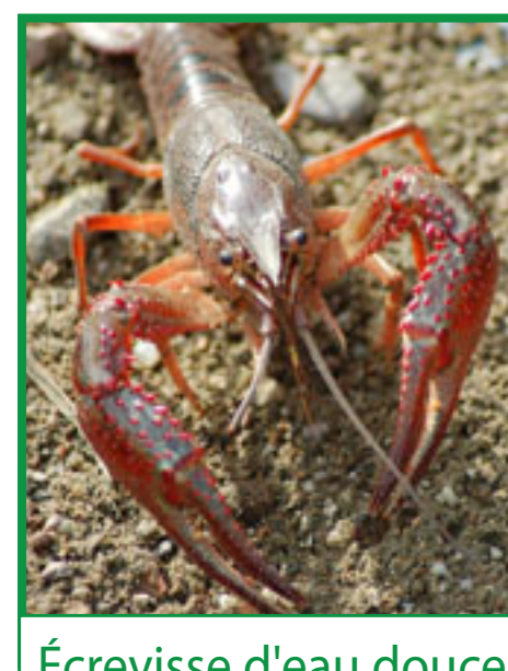
Écrevisse d'eau douce