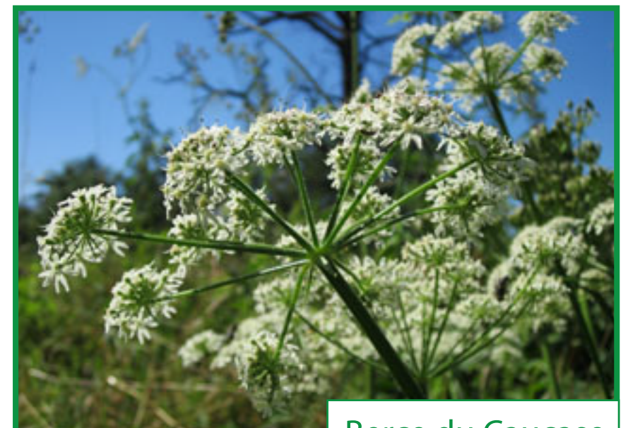
Berce du Caucase

La berce du Caucase ( Heracleum mantegazzianum ) est une plante géante de la famille des ombellifères qui peut atteindre 2 à 4 m