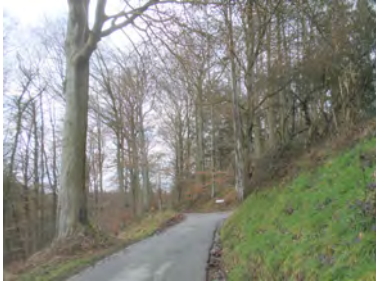
Drève des Etangs