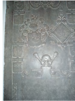
Pierre tombale de la famille le Rousseau

Toujours à l'abandon, le superbe édifice se dégrade. La ferme, également délabrée, cesse ses activités en 1869. Le parc et les ruines inspirent alors à E. Van Bommel le roman "Dom Placide" (1875) et le site enchanteur attire de nombreux touristes qui débarquent à la gare de Noirhat.