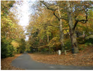
Drève des Châtaigniers