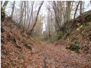
Chemin de Wavre