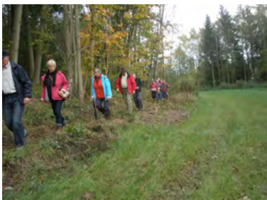
Sentier du Pont Spilet