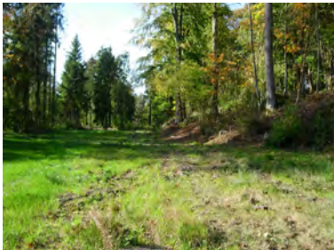
Bois de la Tombe des Romains