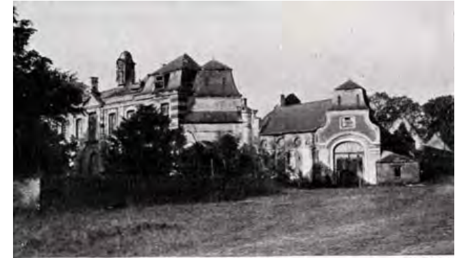
CHATEAU DE LA MOTTE. Demeure seigneuriale du milieu du XVIII e siècle, ruinée sous la Révolution.

Sur le promontoire de La Motte entre le Cala et le ri de Pallandt