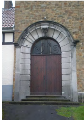
Portail d'entrée de la chapelle de Noirhat