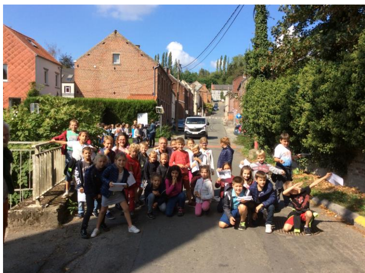
En 2018, le RAVeL a remplacé la ligne de chemin de fer

L'objectif que le groupe s'était fixé était de reprendre des photos aux mêmes endroits avec le même point de vue, 120 ans plus tard.