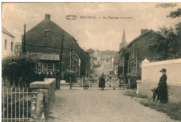
Passage à niveau de la rue du Grand Arbre en 1926