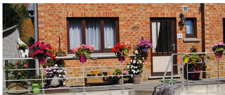
Avenue des Habitations modernes 54

Le bel été dont nous avons bénéficié n'a pas été tendre avec les fleurs et les plantes qui ont souffert de la sécheresse.