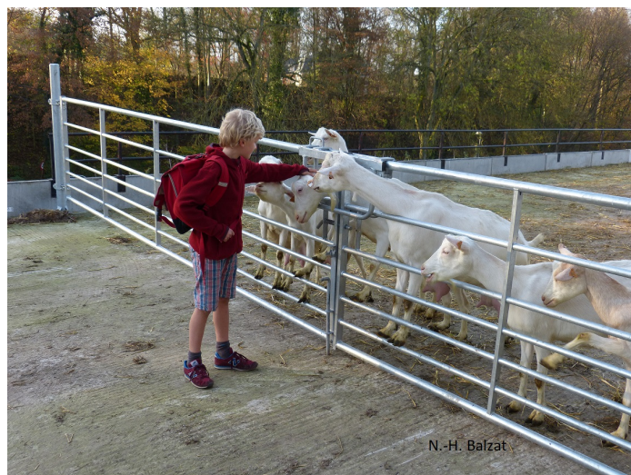
Chèvres de La Baillerie qui produit leur fromage

4a. Agriculture : Les fermes proposant des produits locaux (26 votes).