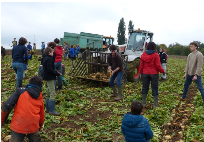
La Baillerie, arrachage manuel des betteraves avec l'aide des scouts

5. Social : Répondre aux besoins des jeunes : développer et soutenir les activités pour jeunes comme une Agora, un mur pour tags, un stage gratuit aux Ateliers du Léz'Arts pour chaque enfant, développer des lieux de rassemblement... (12 votes).