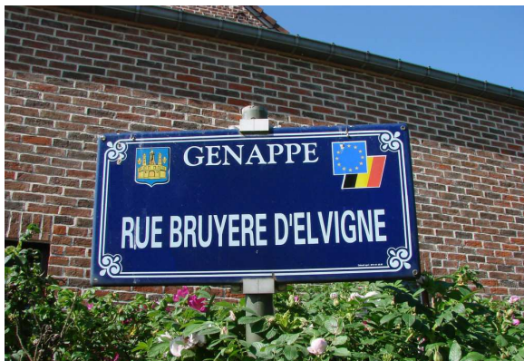
BOUSVAL hameau du Sclage