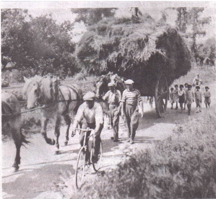
Sur la route entre Ways et Bousval... «Vacances» dans le Brabant Wallon en 1928!

Très concrètement, faites nous parvenir au plus tard le vendredi 5 août vos photos en noir et blanc ou couleur soit par courrier électronique à l'adresse photosdeBousval@yahoo.com soit par la poste à l'adresse Amis de Bousval -Exposition photos- 41 rue du Château 1470 Bousval.